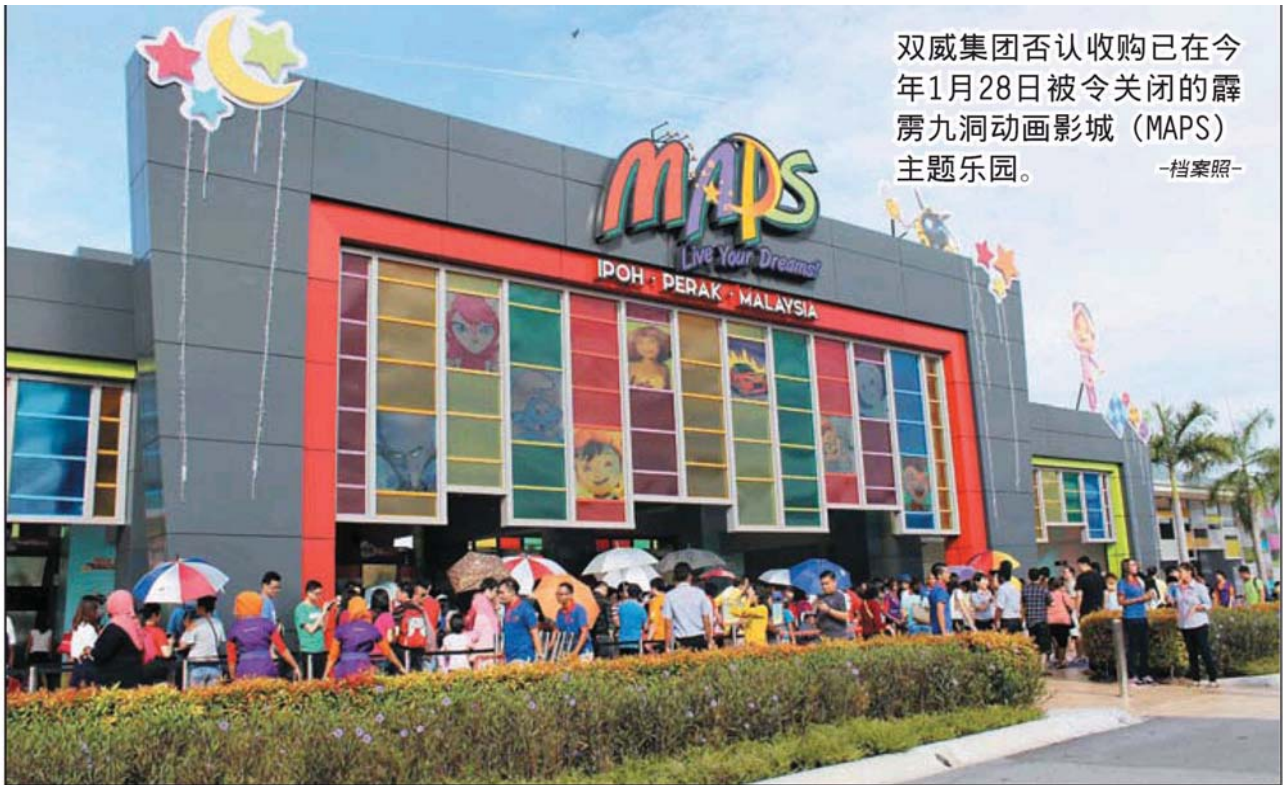
双威集团否认收购已在今年1月28日被令关闭的霹靂九洞动画影城 (MAPS) 主题乐园。 —档案照—