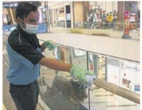
■每一层的围栏天天进行消毒，工作人员仔仔细细擦拭。

消毒等。 至于雪州政府方面，州政府暂时没有下达指示给各地方政府，主要是由各地方政府各自进行防范工作。