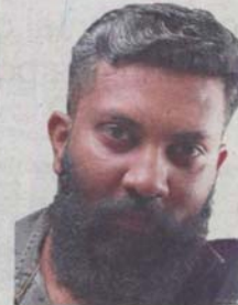
Wicky hosted a clean-up drive last year and is organising a bigger effort this year.

"They should at least place rubbish bags near their stalls, which they can then tie up to be picked up later," he said.