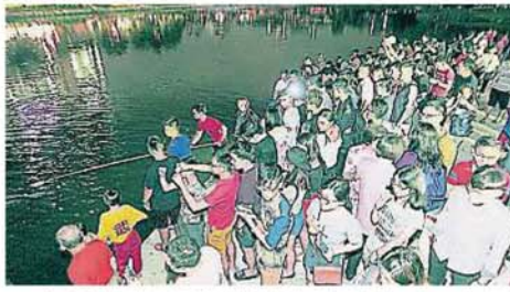
由于再也湖泊公园附近有轻快轨道及高压电塔，所以八打灵再也市政厅呼吁民众勿点放孔明灯，避免造成危险。

由于出席元宵节活动的人潮非常多，加上该湖泊公园附近有马路、轻快轨道及高压电塔，所以不鼓励民众点放孔明灯，因为具有一定的危险性。