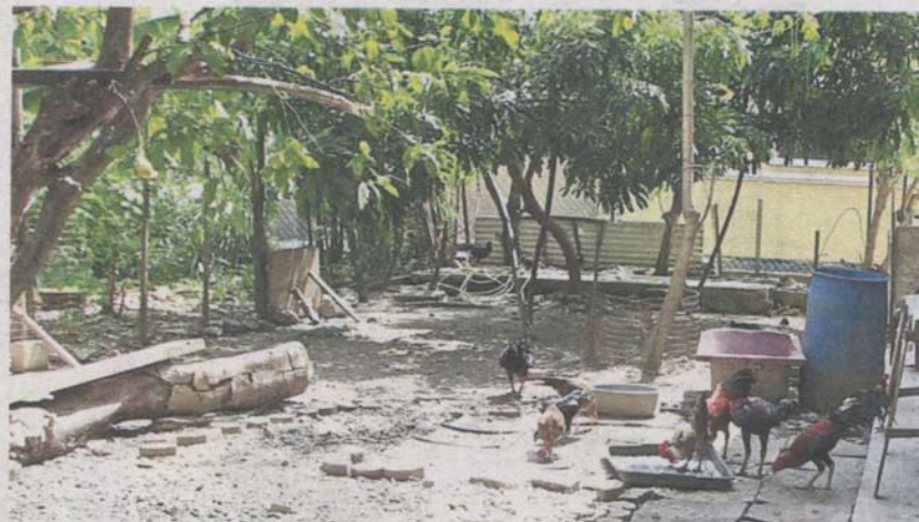
MPK finds about 30 chickens and geese at a terrace house in Klang.

According to a Reuters report, China's ministry of agriculture and rural affairs had last Saturday stated that the bird flu case occurred on a farm which had