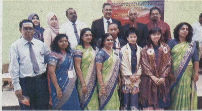
தலைமையாசிரியர்களுடன் துணைக் கல்வியமைச்சர்

கடந்த ஆண்டிலிருந்து ஆரம்பப் பள்ளி முதலாம் ஆண்டு முதல் மூன்றாம் ஆண்டு வரைக்குமான வகுப்புத் தேர்வுகள் நீக்கப்பட்டுள்ளதால், மாணவர்களின்