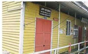
「彈塗魚的記憶」改造前是勞德華小的舊校舍。