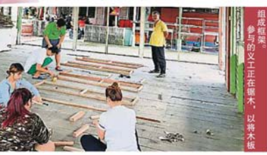
組成框架，參與的文士正在鑽木，以將木板