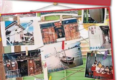
照片內展示的是海南村內的著名景點，其中有愛群劇社、琼会兴等。