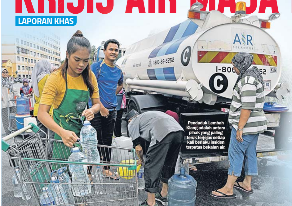
Penduduk Lembah Klang adalah antara pihak yang paling teruk terjejas setiap kali berlaku insiden terputus bekalan air.

Pakar-pakar industri air memberi amaran bahawa 32 juta rakyat Malaysia berisiko mengalami kekurangan bekalan air bersih dalam tempoh tidak sampai 20 tahun akan datang ekoran peningkatan populasi penduduk.