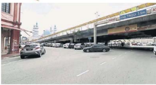
回轉，駛入梭羅柏沙和火車站1路。 ■从巴生南区警察局驶来的车辆，不能直 接右转驶入彭亨街，只能在天桥下做个