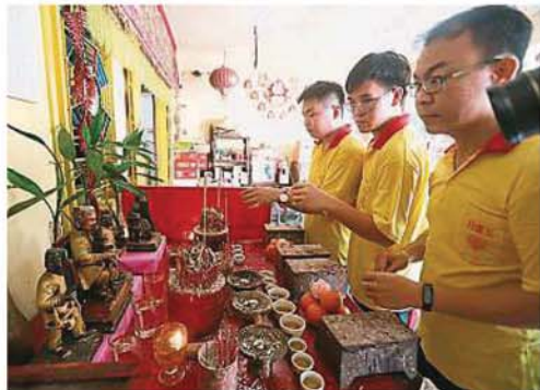
玉虚宫理事将拿督公的神像暂时安置在玉虚宫，并希望市议会能给予批准，让拿督公安置在原处。