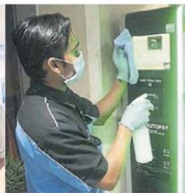
■缴付车费的泊车费缴付机, 也是要定期进行消毒工作。