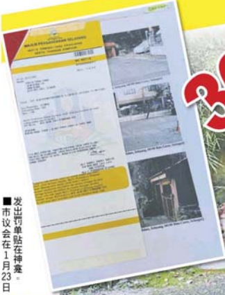
■2个被拆除的神龛, 剩下断瓦残垣。