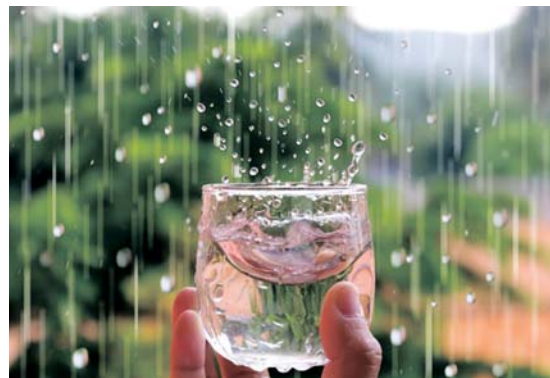
Azman mencadangkan kerajaan meneroka teknologi penyimpanan air hujan seperti pembinaan kolam takungan banjir, empangan bawah tanah dan kolam takungan hujan berdekatan laut.