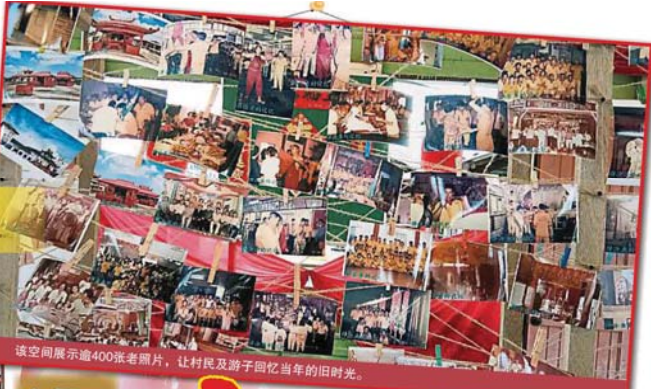
該空間展示逾400張老照片，讓村民及游子回憶當年的旧時光。