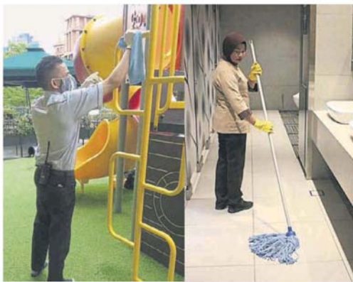
■工作人员在儿童游乐设施处, 进行各项消毒工作。