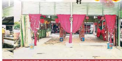
「彈塗魚的記憶」前身為巴生勞德華小的舊校舍，如今經巧手改造後，成為游子及遊客拍照打卡的地方。