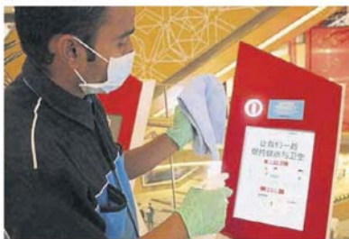
■一些购物广场也设立告示牌, 提醒公众小心 提防及注意卫生。