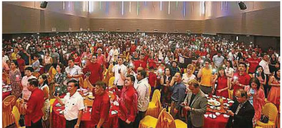
与会的善长仁翁亮起手机手电筒,诚心为武汉祈福。

今次晚宴主题所带出的意义是善长仁翁一条心、团结一致,同心同德并同声呼吁扶持修成林的“慈善、医疗、文化、教育”四宏誓愿及工程如火如荼进行中的修成林国际学校(特殊教育)。