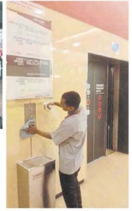
■升降机的按钮处，也要进行消毒。