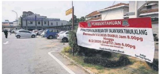
■市议会已经提前在一些地点悬挂横幅，提醒民众改道事宜。

“当晚演出队伍庞大，多达550人，都是来自本地学校、社团、居民等，演出内容包括有二十四节令鼓、舞狮、舞龙、手语、扯铃、太极18式、传统舞蹈、财神爷等，主要以中