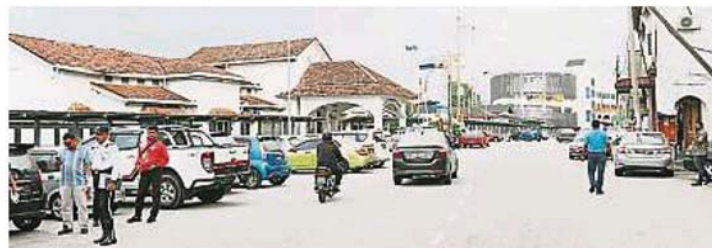
首次移师户外举行的巴生市议会新春大团拜，把场地选定在具有巴生历史特色的南区大街彭亨井路段举行。不远处为拥有近600个泊车位的巴生火车站旁多层停车场，可满足大团拜的泊车需求。

大团拜将邀请雪州大臣拿督斯里阿米鲁丁莅临主持开幕仪式，其余贵宾有雪州行政议员兼巴生新城区州议员拿督邓章钦、行政议员兼巴生海峡区州议员拿督阿都拉昔、当地班达马兰区州议员梁德志及巴生区国会议员查尔斯等。