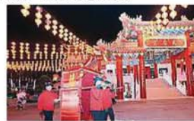
雪隆海南会馆（天后宫）在元宵节当晚将与南洋商报和爱FM联合“万民同欢庆，元宵乐满天”的元宵晚会。

联办单位有沙登新村村委会、梳邦再也市议会第21至24区居民委员会（JKP MPSJ Zon 21-24）、梳邦再也市议会第20至24区地方青年推动委员会（P-BT MPSJ Zon 20-24）及沙登妇女活动中心。