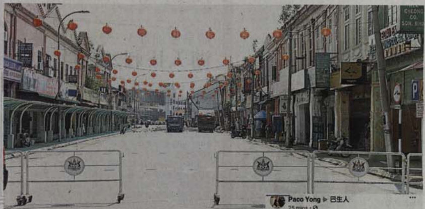
巴生市议会为周五的大团拜封路，并将整条大街张挂上红灯笼，营造新春气氛。