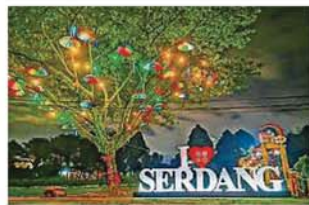
沙登社区服务中心不久前翻新了一系列“I Love Serdang”的坐标，并成为大家前来拍照打卡的景点。

活动 嘉迎中华小学、华中、独中三母校校友携眷出席庆典，校友会届时也将集合三校同学呈献精彩节目，同时也有猜灯谜送礼篮、书法家挥春、派红包及自由餐招待。