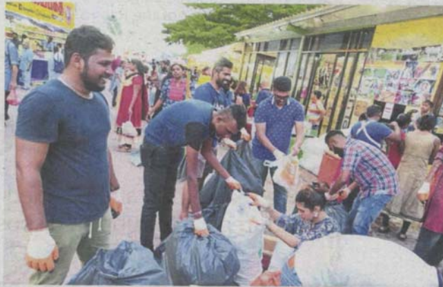
Young volunteers clearing and picking up rubbish in the Batu Caves temple compound during last year's Thaipusam.

Task force aims to keep areas around Batu Caves clear of waste