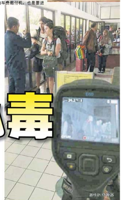
■马来西亚铁道有限公司也在主要车站为搭客测体温。