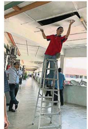
万挠彩虹花园组屋屋顶长期漏水,走廊天花板已破出大洞,仅能以木板遮盖。