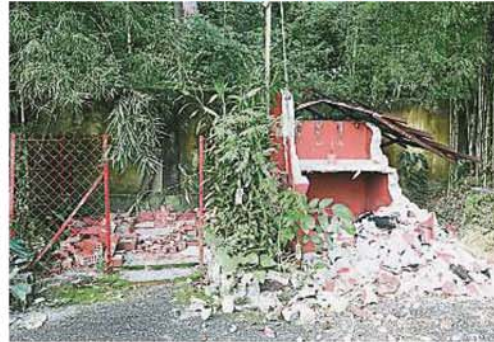
尽管玉虚宫表示已向市议会提出在该土地设立拿督公庙的申请，不过拿督公庙依然逃不过被拆除的命运。

岂料，市议会却在本月4日前去拆除该拿督公庙，当局当时也未出示任何拆除信函及通知，令玉虚宫感到惊讶及措手不及。