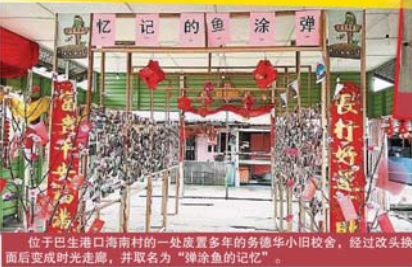
位於巴生港口海南村的一處廢棄多年的勞德華小舊校舍，經過改造換面後變成時光走廊，並取名為「彈塗魚的記憶」。