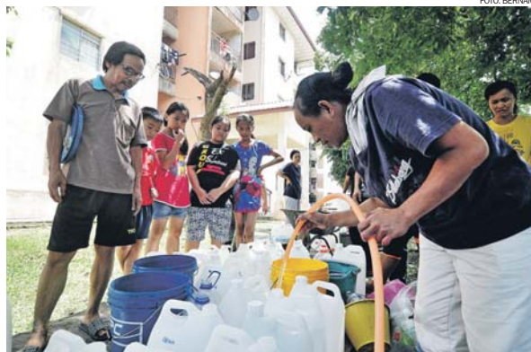
Pada tahun 2019 sahaja sebanyak sembilan kali gangguan bekalan air berlaku di Lembah Klang.

Atas faktor geografi, lembangan sungai di Malaysia terutama di kawasan muka sauk sangat terdedah dengan risiko berlaku pencemaran sama ada menjadi lokasi pelupusan sisa pepejal jenis pukal seperti perabot sehinggalah kepada sisa toksik.