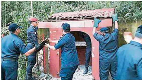
士拉央市议会人员动员近20人，前来拆除拿督公庙。