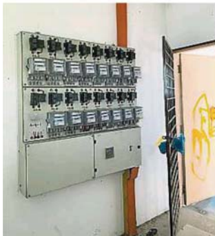
组屋位于顶楼的电房亦因为漏水而有发生电流短路的危险,让数以百计的居民担心会发生死亡意外。