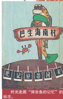
時光走廊「彈塗魚的記憶」的標誌。

「我們也希望海南村的時光走廊能吸引更多外來的遊客來拍照打卡，參觀這裡的環境與了解該村的历史，感受漁村傳統風土人情。」